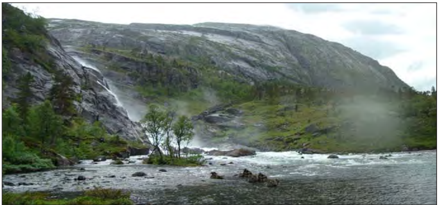
Im Tal von Kinsavik am Sørjord

Am diesem See mit Eisbergen und schwarzem Sandstrand hat es uns gut gefallen.