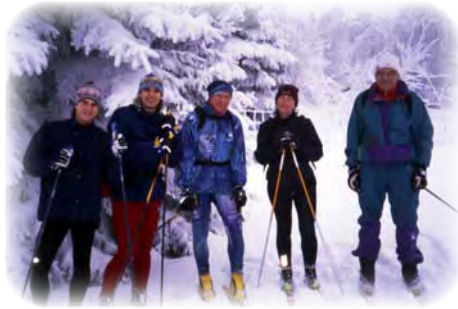
„schnelle“ Tourenläufer unterwegs