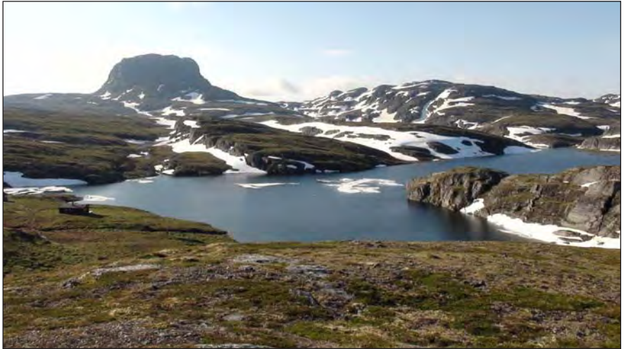
Der Hörteigen und im Vordergrund die Torehytten

Am diesem See mit Eisbergen und schwarzem Sandstrand hat es uns gut gefallen.